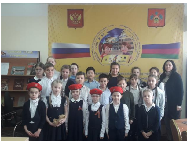
Урок Мужества в школьной библиотеке