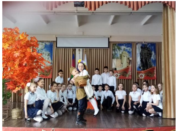
Конкурс инсценированной песни