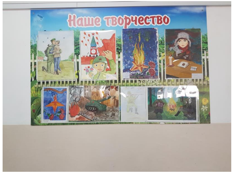
Конкурс чтецов и конкурс рисунков к Дню Защитника Отечества