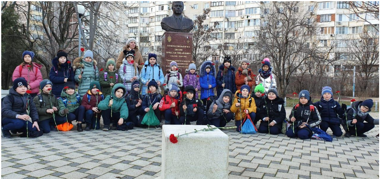
Возложение цветов к памятнику Герою России Вячеславу Евскину