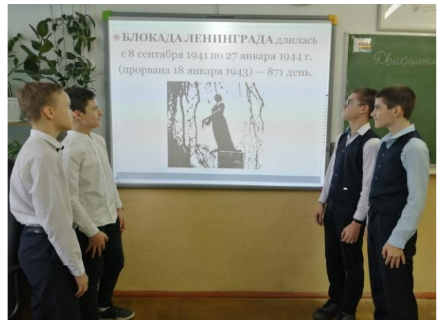
Уроки Мужества в честь 76-летия снятия блокады Ленинграда