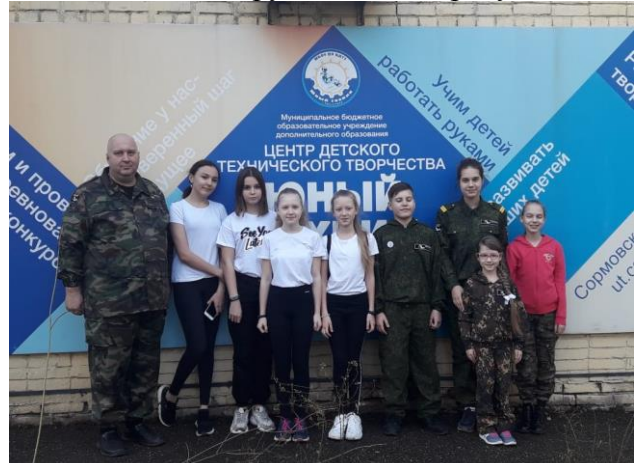
Школьный поисковый отряд «Патриоты Кубани»