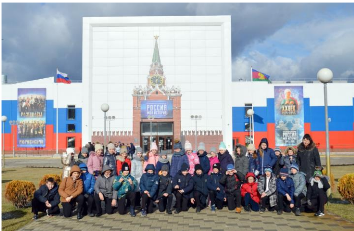
Ребята на экскурсии в историческом парке «Россия – Моя история»